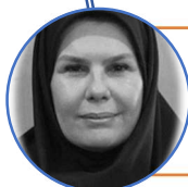
دکتر مریم رسولی مدیر کل پرستاری وزارت بهداشت